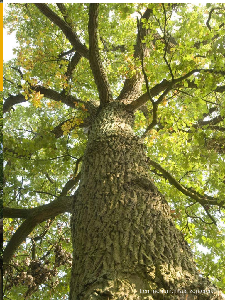
Een monumentale zomereik

Fietsers vinden hun gading langs de bewegwijzerde Hermesroute en langs andere paden in het bos waar dit toegelaten is. Paardrijden en mountainbiken kan ook op de hiertoe aangeduide paden. Verder zijn er voor het jonge volk twee speelzones, eentje voor kinderen jonger en eentje voor kinderen ouder dan 12 jaar. In de speelzone aan de Boekzitting zijn er enkele houten speel- en klimtoestellen. En in de bivakzone kan je in de volle natuur, maar netjes volgens de regels, kamperen! De liefhebber van cultureel erfgoed kan een bezoek aan de Geuzentoren en de grafheuvel aanvragen bij Toerisme Ronse.